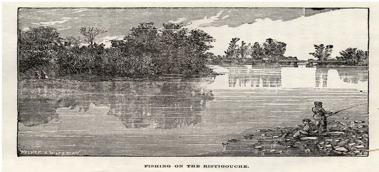
Rivière Ristigouche (1881)

Ainsi, la chute démographique, déjà signalée à la fin des années 1950, s'accéléra entre 1961 et 2001. Ces localités perdront près de 41% de leur population durant cette période. L'attrait du monde urbain et la faiblesse des revenus des exploitations agricoles expliquent, en partie, ce phénomène.