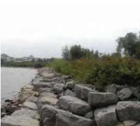
PERRÉS 5 KM SUR 10 ANS

PRINCIPALEMENT DE L'ENTRETIEN, ENVIRON :