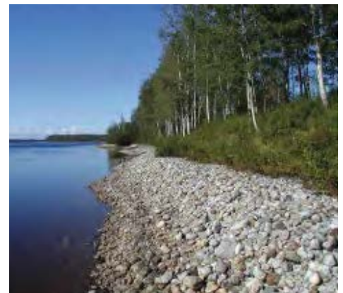
EMPIERREMENTS 1 KM SUR 10 ANS