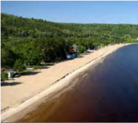
RECHARGEMENT DE PLAGES 20 KM SUR 10 ANS

La relocalisation du canal de la Belle-Rivière fait également partie du Programme de stabilisation des berges 2018-2027.